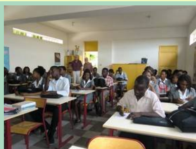
Etudiants de 3ème année dans la grande salle au rez de chaussée.