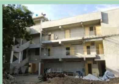
Façade sud vue du fond de la cour.

La cuve à eau au 3ème qui sert de château d'eau. Elle est reliée à la citerne située sous le bâtiment. Celle-ci contient 150 m 3 . L'eau est recueillie sur les toits en terrasses au 3ème. Avant le cyclone Tomas, il a fallu faire venir 2 camions d'eau (10 m 3 l'un) car la citerne était à sec. On est pourtant en fin de saison des pluies. Depuis le passage de Tomas, elle est à nouveau approvisionnée mais pour combien de temps ? Beaucoup d'enfants, d'étudiants et de maçons en même temps ! Et le béton pour les fondations du bâtiment 2 en nécessite aussi.