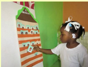
Une élève de petite section remplit sa case de "présence".