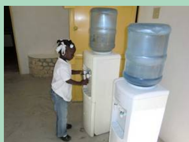
Sous le hall à disposition des enfants et des étudiants, eau de citerne filtrée et rafraîchie.

Cour de récréation. Les enfants jouent ici comme ailleurs mais ici les filles utilisent encore la grande corde à sauter.