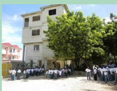
Bât 1 vu côté ouest avec enfants du matin rassemblés avant d'entrer en classe.

Au 1er plan, les travaux de terrassement du bâtiment 2 (normes parasismiques)