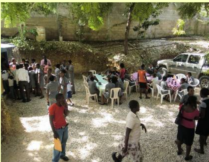
Les étudiants prenant leur repas-sandwich lors de la pause de 10h.

Cette année, l'école compte 7 classes : PS, MS, GS, CP1, CP2, CE1, CE2. Le CM1 sera ouvert l'année prochaine, le CM2 dans 2 ans. Les cours ont lieu de 8h à 13h, avec 2 pauses. L'accueil est assuré à partir de 7h30 par 2 étudiants « de service ». A la pause de 9h45, les enfants sortent un repas de leur « boîte à lunch » ou, pour les plus « fortunés », achètent casse-croûte et boisson à la « dame » qui prépare les sandwiches des étudiants. Les institutrices et instituteurs bénéficient aussi du sandwich gratuit.