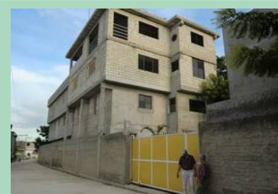
Pignon ouest vu de la rue et façade nord le long de la rue. Ce bâtiment est quasiment terminé ; toutes les salles sont utilisées et pleines "comme un oeuf".